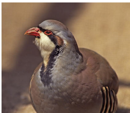
Fig.1 : Perdrix rouge adulte

Riche de ses succès et de son expérience, cette entreprise a jugé opportun de s'implanter en France, pays dans lequel les dernières estimations de lâchers n'ont cessé d'augmenter depuis 1970, année où furent lâchées 400 000 Perdrix rouges, puis 800 000 dans les années 80 pour atteindre 2,5 millions en 1996 (informations fournies par l'Office national de la chasse et de la faune sauvage - ONCFS - en 2013).