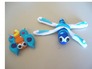
Insectes en pâte Fimo

Le Musée d'Histoire Naturelle et d'Ethnographie de Colmar vous propose ses Ateliers du mercredi sur le patrimoine naturel et culturel de l'Alsace et du monde.