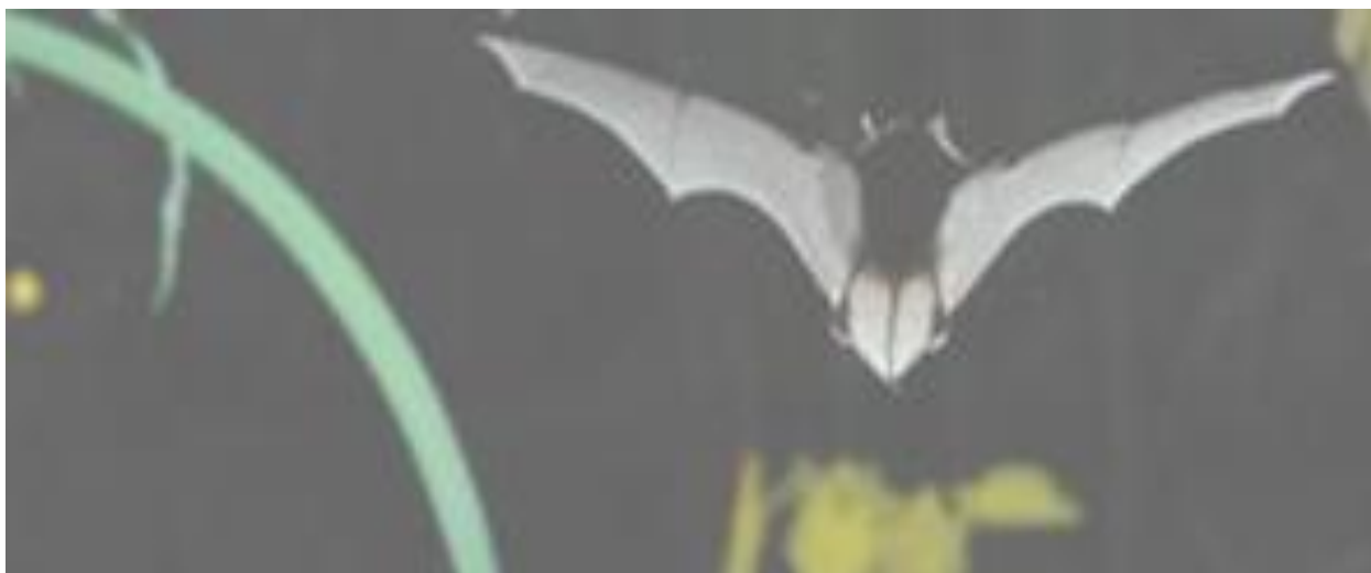
Daubenton en vol

Dans cette exposition, créée pour vous faire découvrir cet animal nocturne, tant mal connu que mal aimé, vous apprendrez, de façon ludique et pédagogique, qu'il est le seul des mammifères à savoir voler. Ce n'est donc pas, contrairement aux idées reçues, un oiseau. En France, cet animal insectivore chasse des milliers de moustiques et de papillons de nuit et joue ainsi un rôle écologique très important.